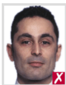
โก่งเกินไป