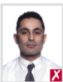
โก่งเกินไป