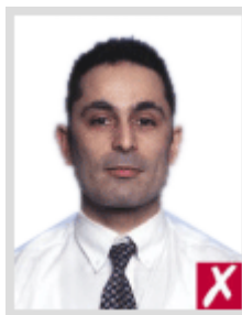
โก่งเกินไป